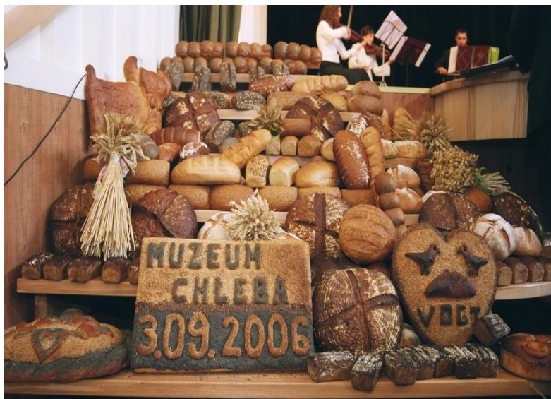
Die Ausstellung vom frisch gebackenen Brot