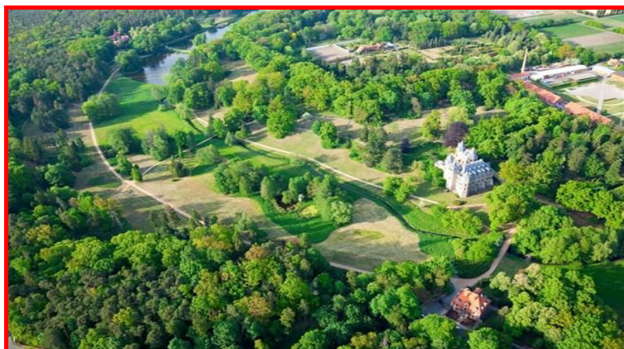
Ansicht des Parks aus der Vogelschau