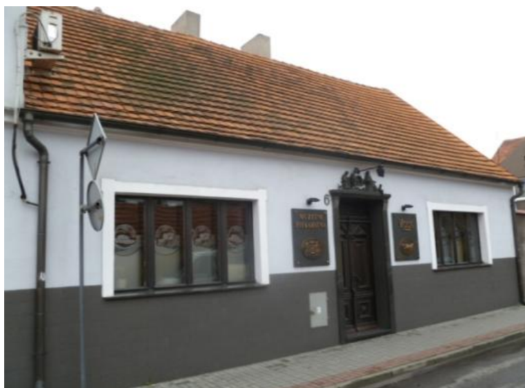
Das Museum von außen